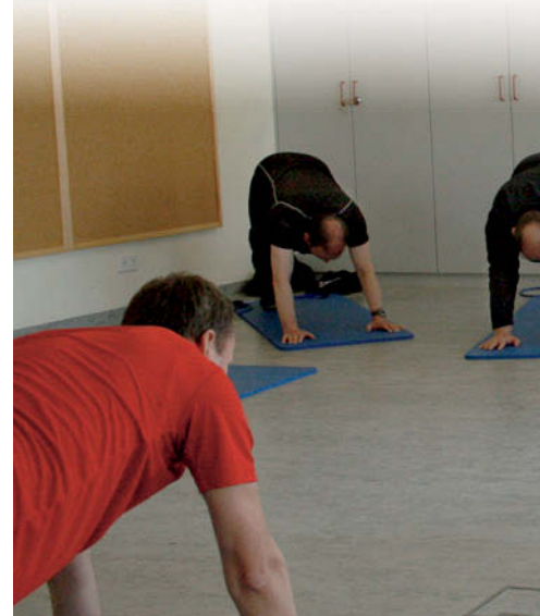
Abb. 1: Sportliche Übungen gehören von nun an zum