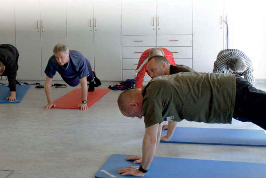
Pflichtprogramm jeder RettAss-Fortbildung der DRF Luftrettung